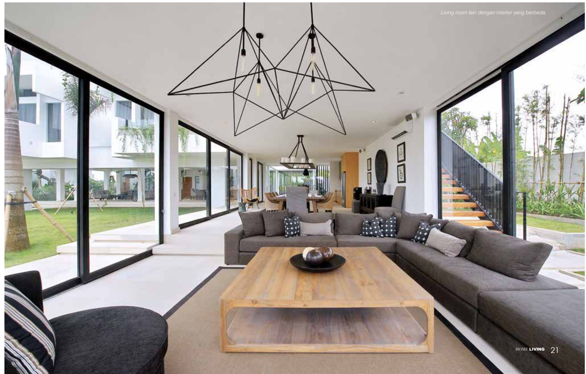
Living room lain dengan interior yang berbeda.