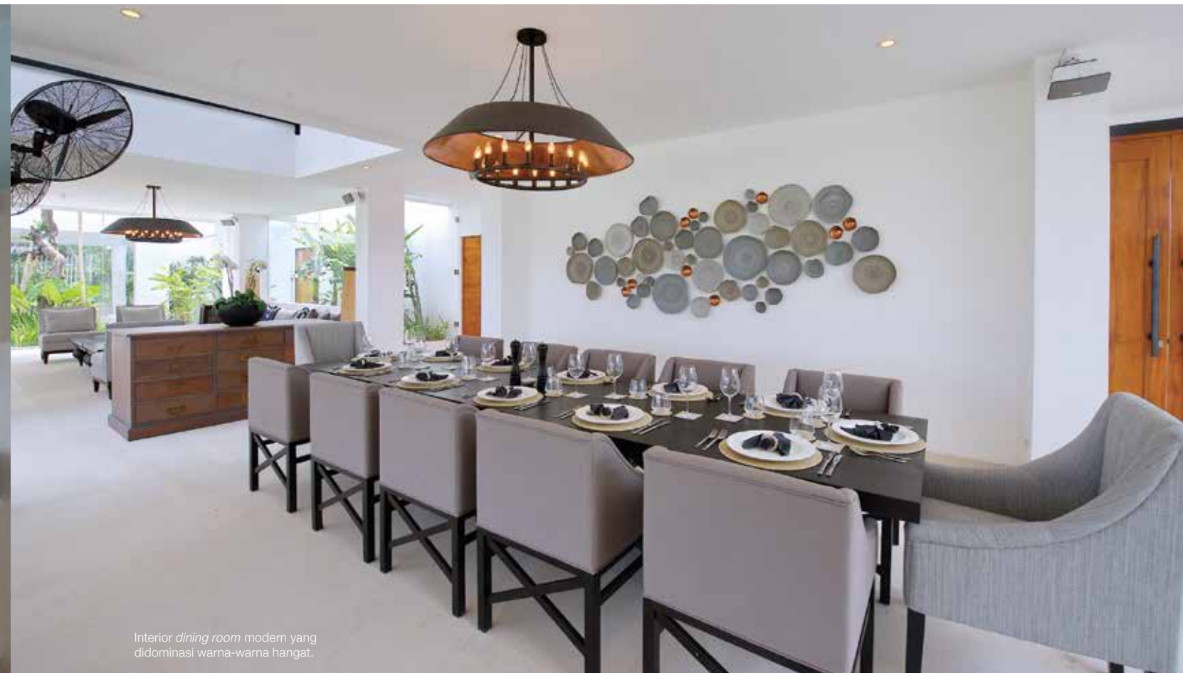
Interior dining room modern yang didominasi warna-warna hangat.