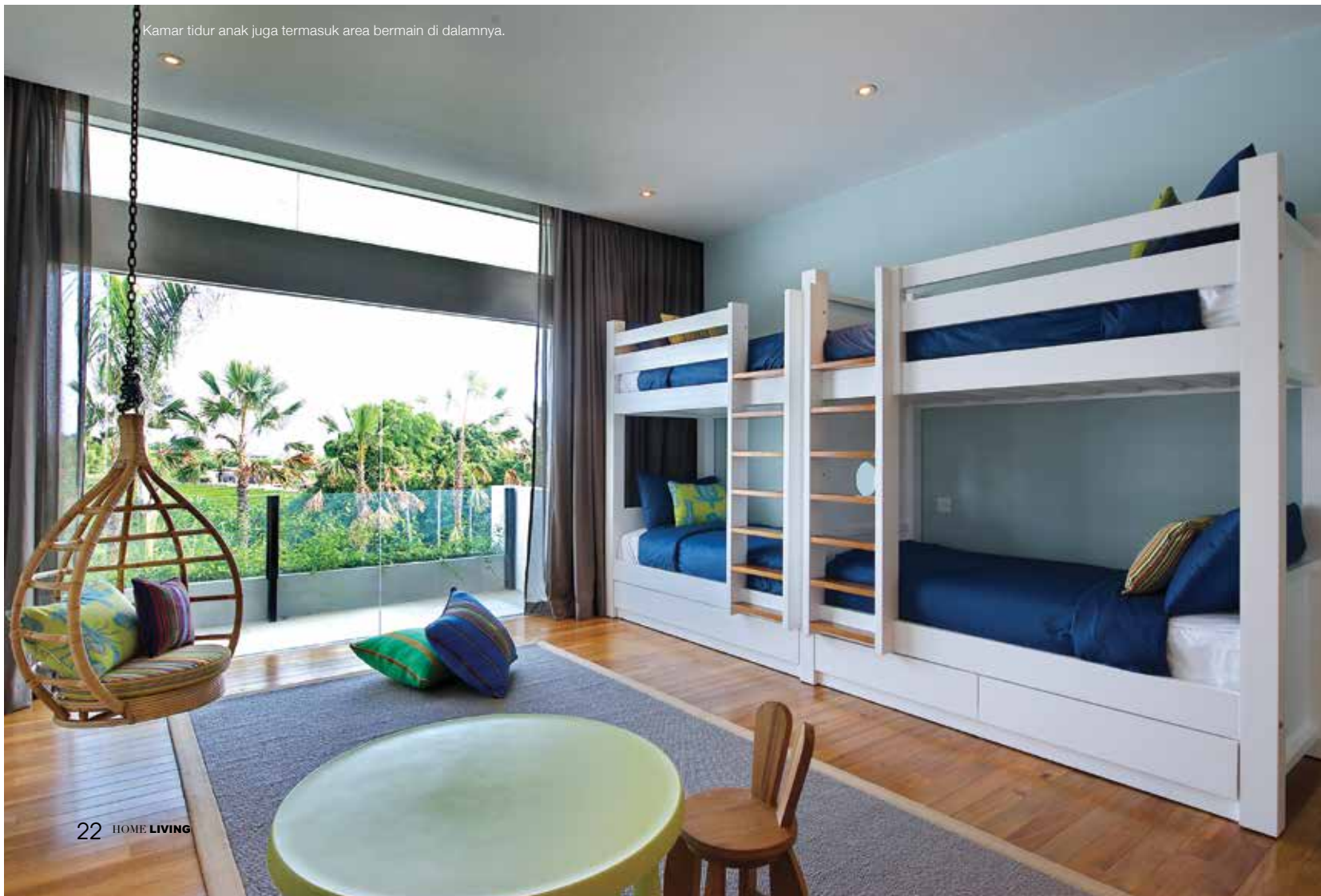
Kamar tidur anak juga termasuk area bermain di dalamnya.

Menurut Felipe, keputusan yang paling menantang adalah, bagaimana menyesuaikan arsitektur modern-kontemporer ke dalam konteks alam yang alamiah dan natural , seperti keadaan alam Bali. Konsep itu juga mengenai kombinasi antara komposisi garis-garis horizontal yang berpadu dengan garis vertikal pada bangunan villa . Dan Tentu saja, Felipe juga lebih memilih bahan dan material lokal, seperti batu Singaraya yang menjadi bagian cukup banyak sebagai elemen proyek, serta kayu-kayu jati hasil recycle . Bahan alami dan natural dari material recycle membuat villa ini seperti kembali pada alam. Felipe menyukai unsur daur ulang dalam mendesain karyanya.