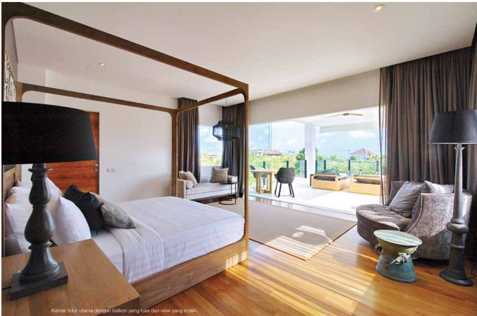
Kamar tidur utama dengan balkon yang luas dan view yang indah.