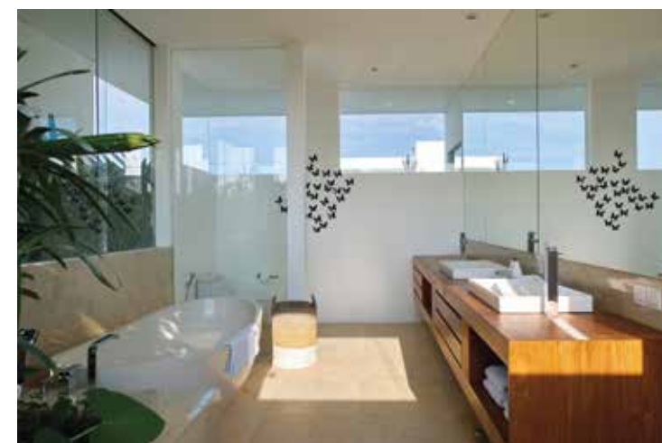
Salah satu tipe bathroom yang ada di villa ini.