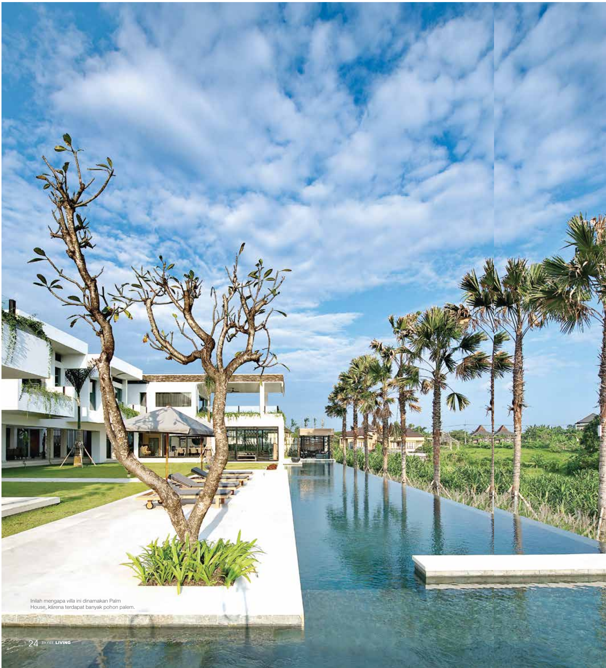
Inilah mengapa villa ini dinamakan Palm House, karena terdapat banyak pohon palem.