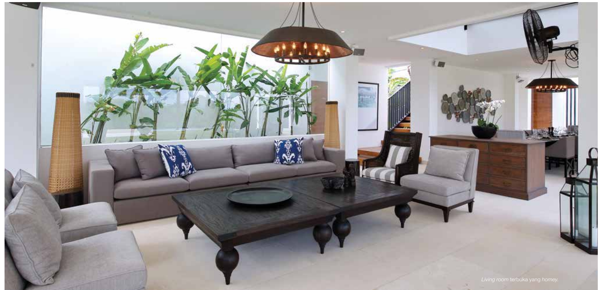
Living room terbuka yang homey.

Bentuk bangunan villa ini menyerupai huruf L. Pada sisi yang memanjang, terdapat ruang makan terbuka dan sebuah living room. Semua ruang menghadap ke arah luar dengan view pemandangan hijau yang indah. Pada sisi bangunan lainnya berisi pantry, dining room, dan living room. Villa yang baru saja selesai dibangun ini, menggunakan desainer interior dari Australia, Ros Hemley yang memberi nuansa dominan hangat pada seluruh interior villa. Interior nampak elegan dengan beberapa hiasan dinding sebagai unsur dekoratif yang menarik. Sementara keindahan taman di villa ini adalah hasil rancangan landscaper, I Ketut Suratman