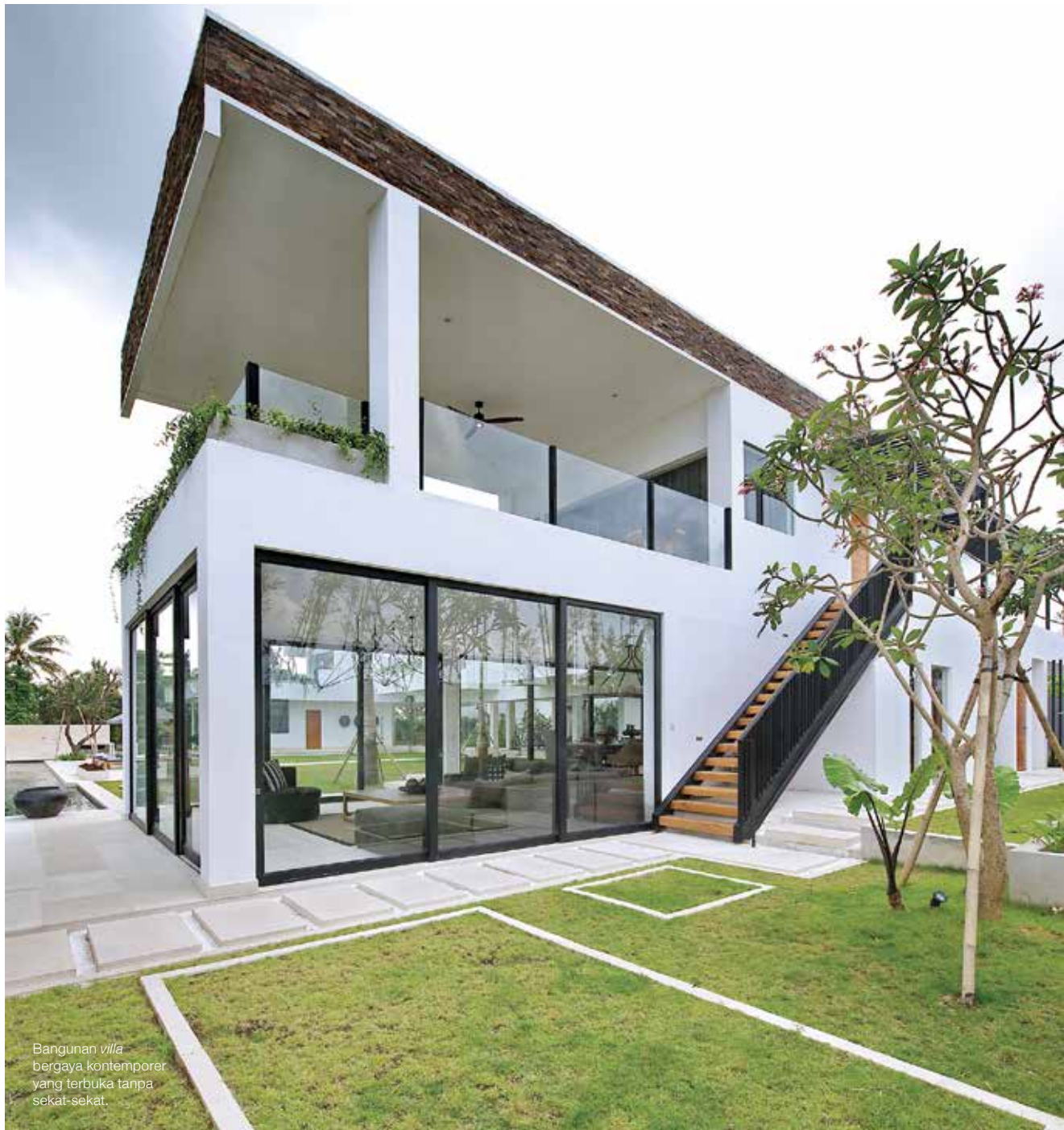
Bangunan villa bergaya kontemporer yang terbuka tanpa sekat-sekat.