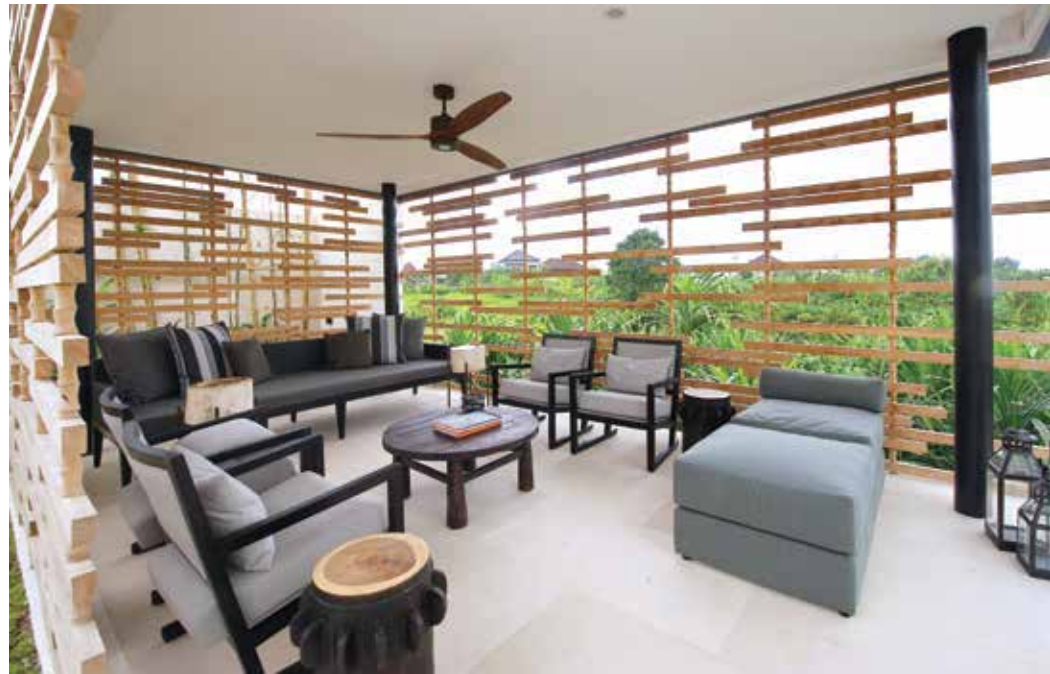
Area duduk-duduk santai di dekat kolam renang.